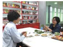
本物の味を再現するため、試作を何度もトライ!

国際コミュニケーション学科・国際ビジネスキャリア専攻の鶴岡ゼミの学生が、ビジネス系科目の授業の一環として、販売促進を担当。計画の立案からアフターフォローまで、一貫して行います。