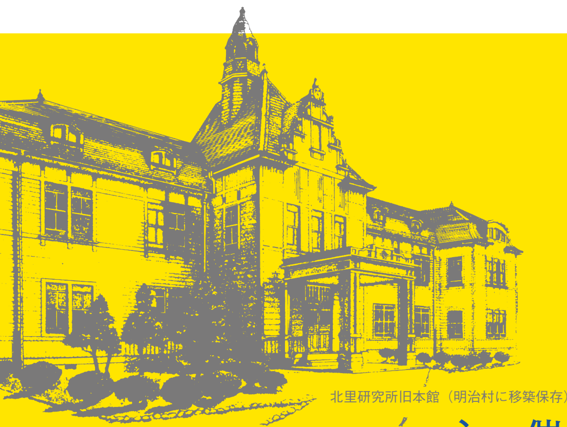
北里研究所旧本館 (明治村に移築保存)