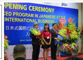
日本式国際ビジネス学士課程の入学式の模様

首都ハノイに所在する文系総合大学。ベトナム最難関大学の一つで、教育の質も高く評価され、官民に多くのリーダーを輩出する。1960年に、外務省の外交・貿易職員養成のため大学として創立。現在でも、外交分野や経済界へ多くの人材を送り出す。1970年代前半から、日本語教育に取り組み、2006年には日本語・日本文化コースを開設。2017年に、ハノイ貿易大学傘下の日越人材協力センターが中心となり、日本式国際ビジネス学士課程を開設。