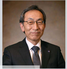
スピントロニクス