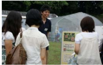
種なしスイカのコーナー