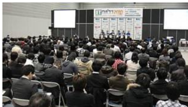
設計モデル審査結果によるワークショップ

ETソフトウェアデザインロボットコンテスト (愛称:ETロボコン) 主催: 社団法人 組み込みシステム技術協会