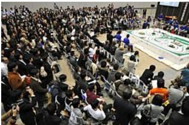
ロボット走行体による競技会