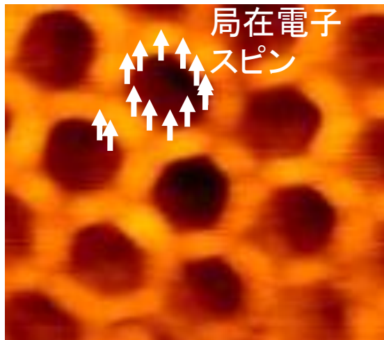
グラフェン磁石(蜂の巣状のナノ細孔アレイ)の原子間力顕微鏡像。