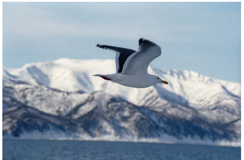
オオセグロカモメ (北海道知床)

表図版= ハチクマ (長野県白樺峠) 部分、左より《鮫と泥鰌》根付：藤生章了作、《巢立》根付：宮澤宝泉作、オジロワシ (北海道知床)