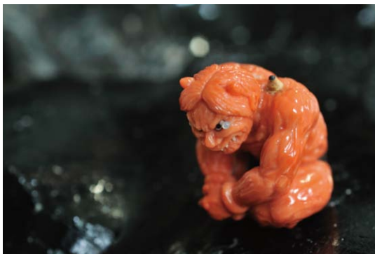
《鬼の目にも涙》根付：森謙次作