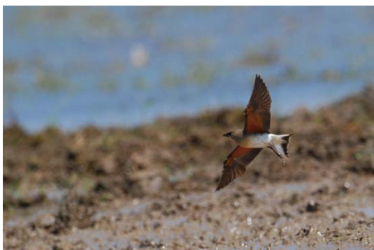
ツバメチドリ (鳥根県出雲平野)