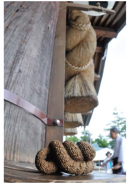
《心ノ鍵》根付：森田正行作

本展覧会では、妃殿下がこれまで撮影されてきた野鳥の写真と根付の写真をご覧いただきます。あわせて、妃殿下の根付コレクションの中から現代根付を展示します。野鳥や自然、根付の小さな技巧の世界を愛しむ、妃殿下のまなざしにふれていただく機会となりましたら幸いです。