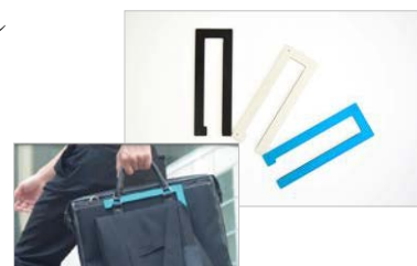
cotoRe の企画商品化第一弾 「ポータブルスーツハンガー」