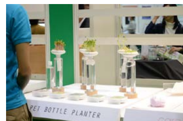
産業交流展 2011 出展の様子