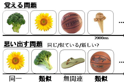
図 1 記憶テストの説明

覚える問題では日常生活で目にする物体の写真を順に示し、思い出す問題では同一、類似、無関連課題に対して、「全く同じ」、「似ているが違う」、「新しく初めて」の三択で回答させた。類似課題に対して「似ているが違う」と正解できた割合から記憶力を評価した。