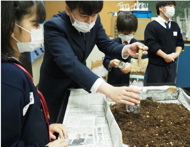
ペットボトルでプランター作り。「コンポスト」チームが作った土を使いました