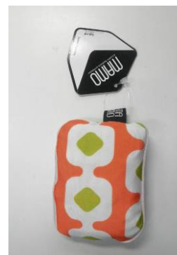
「MAMO」折りたたみ収納時

価格：1,785 円(参考価格/税込) 製造数：3,000 個(各色 500 個/初回出荷時) 販売：6月26日(水)より「三省堂書店楽天市場店」( http://www.rakuten.co.jp/books-sanseido/ )にて発売開始。 その後、順次取扱店舗を拡大する予定。 企画・開発：デザインユニット「cotoRe」 製造・販売：株式会社 セイムトゥー（東京都港区六本木 2-1-13 代表取締役：加藤勇二）