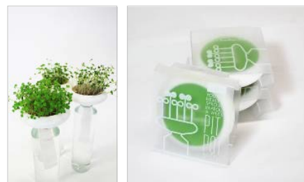
企画商品化第二弾「PIT.POT」 (2012年9月～発売)