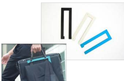
企画商品化第一弾「PORTABLE SUIT HANGER」 (2011年11月～発売)