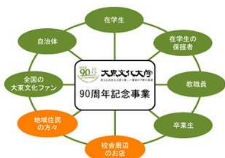
大東文化大学90周年記念事業“繋がり”イメージ