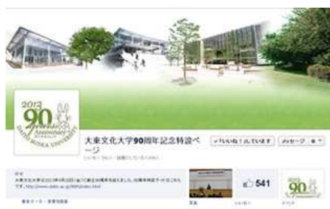
大東文化大学90周年記念特設Facebookページ