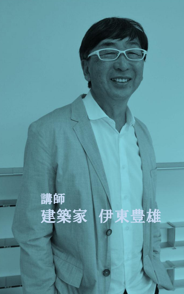
講師 建築家 伊東豊雄