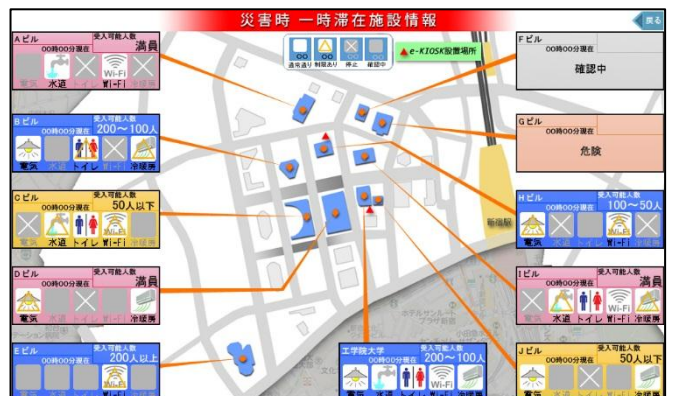
災害時 一時滞在施設情報画面 (この画面が帰宅困難者に公開されます)