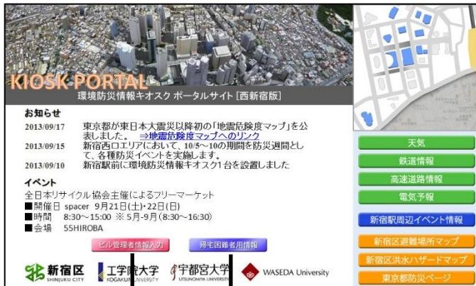
平常時トップ画面(キオスクポータル)

災害時には、キオスクポータル画面から「ビル管理者情報入力画面」に移動し、各ビルの管理者はビルの安全性や各種インフラの使用可能状況などを収集しながら本システムに入力・更新をおこなう。入力された情報はキオスクサーバに集められ、適切なタイミングで、周辺に滞留する帰宅困難者向けに「e-KIOSK」やスマートホンで、一時滞在施設情報として発信する。