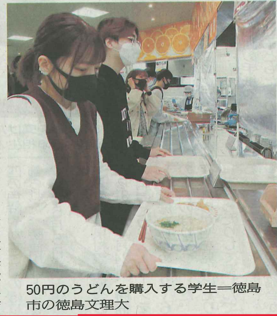
50円のうどんを購入する学生—徳島市の徳島文理大

徳島駅前のアミコビルを運営する徳島市の第三セクター・徳島都市開発は27日、株主総会を開き、2021年1月期決算で経常損失が2億2200万円になったと発表した。前年同期比3億7100万円の減益で、赤字になるのは1999年以来。ところが徳島店の閉店でテナント賃料が大幅に減った上、新型コロナウイルス感染拡大による消費の低迷が影響した。