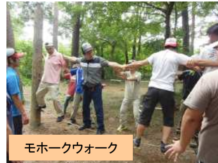
モホークウォーク