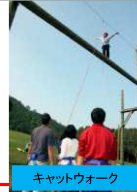
キャットウォーク