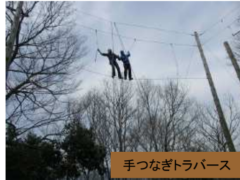
手つなぎトラバース