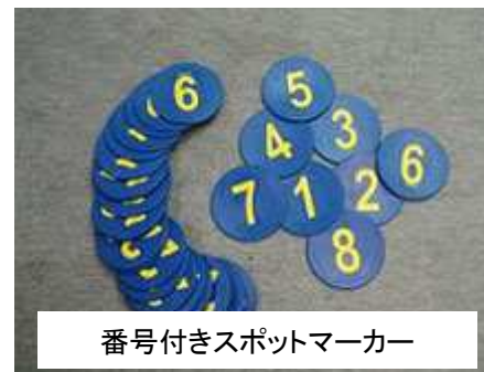
番号付きスポットマーカー