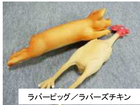
ラバーピッグ/ラバズチキン