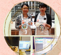
管理栄養士に聞く! 朝ごはんの効果