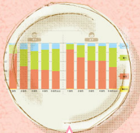
朝ごはん食べてる? 在学生の朝食摂取データ