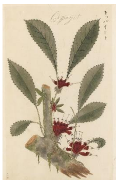
▲ジャワ植物図譜 宇田川榕菴写