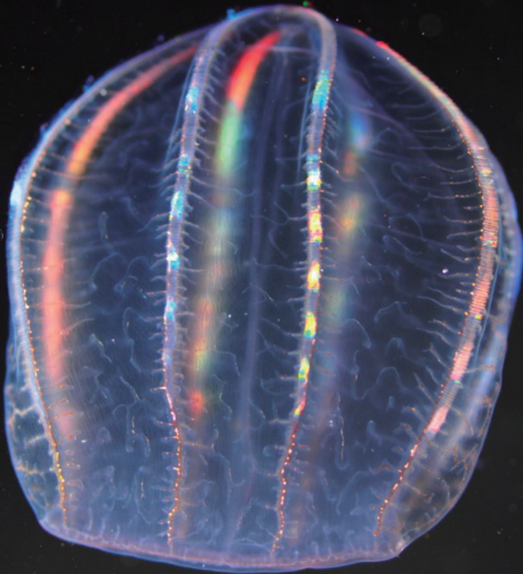
アマガサクラゲ

会場 | 科学技術館(東京都千代田区北の丸公園2番1号) 主催 | 公益財団法人日本科学技術振興財団・科学技術館 協力 | 北里大学海洋生命科学部、独立行政法人海洋研究開発機構、公益財団法人国際科学振興財団 デザイン・制作 | 株式会社エヌ・ティー・エス