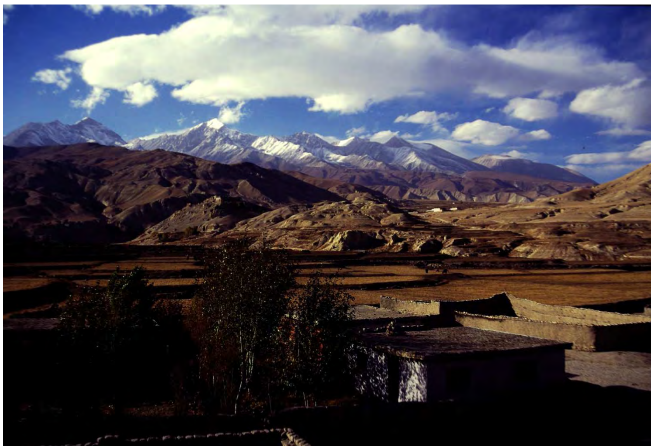
ローマンタンよりムスタン・ヒマールを望む (1997年10月古野淳撮影)