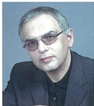
映画監督: カレン・シャフナザーロフ Карен Шахназаров