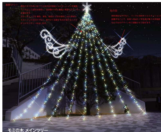
※上図は完成イメージです。

なお、点灯初日の16日には、高校生・受験生や一般の方々にもキャンパスの彩りを楽しんでいただけるよう、下記の通り「イルミネーション点灯式」を実施致します。