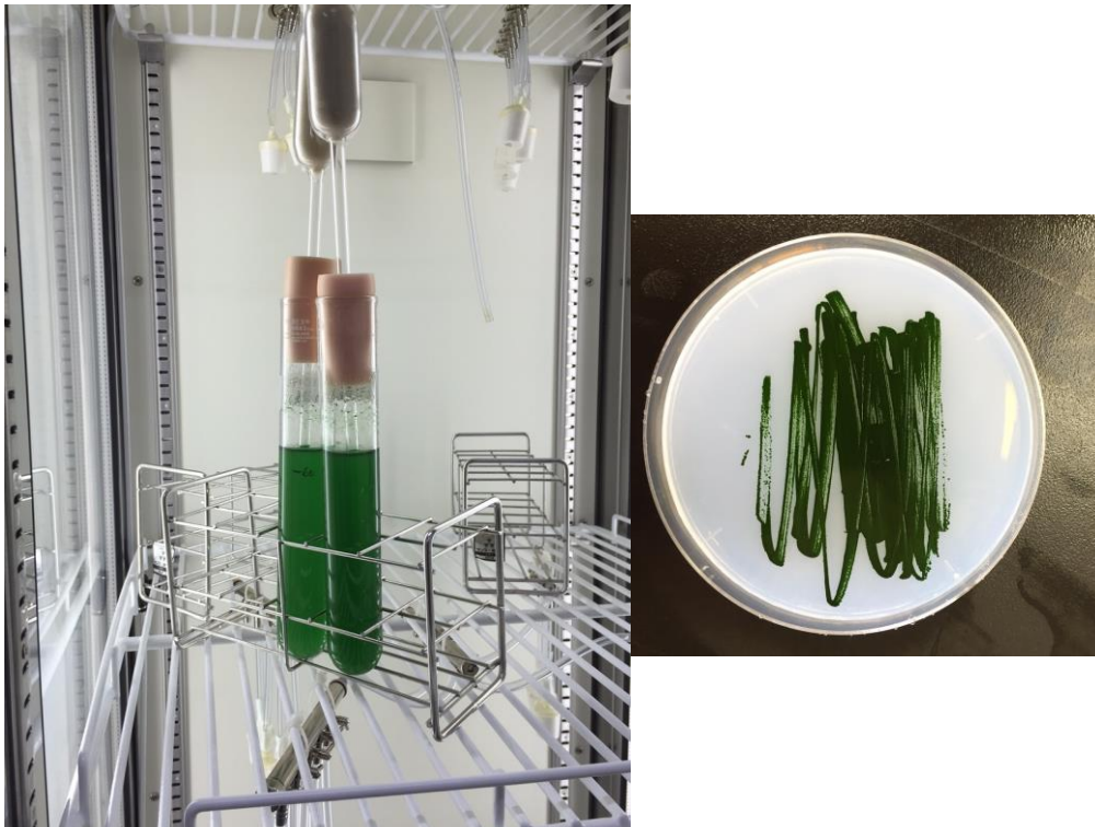
図1 ラン藻の培養の様子

ラン藻は、左図のような温度と光条件を制御できる「人工気象器」の中で培養している。培養時には、1%のCO 2 を混合させた空気を導入して、細胞を攪拌するとともに光合成を促進している。右の写真は、RpaA過剰発現株を寒天培地で培養したもの。