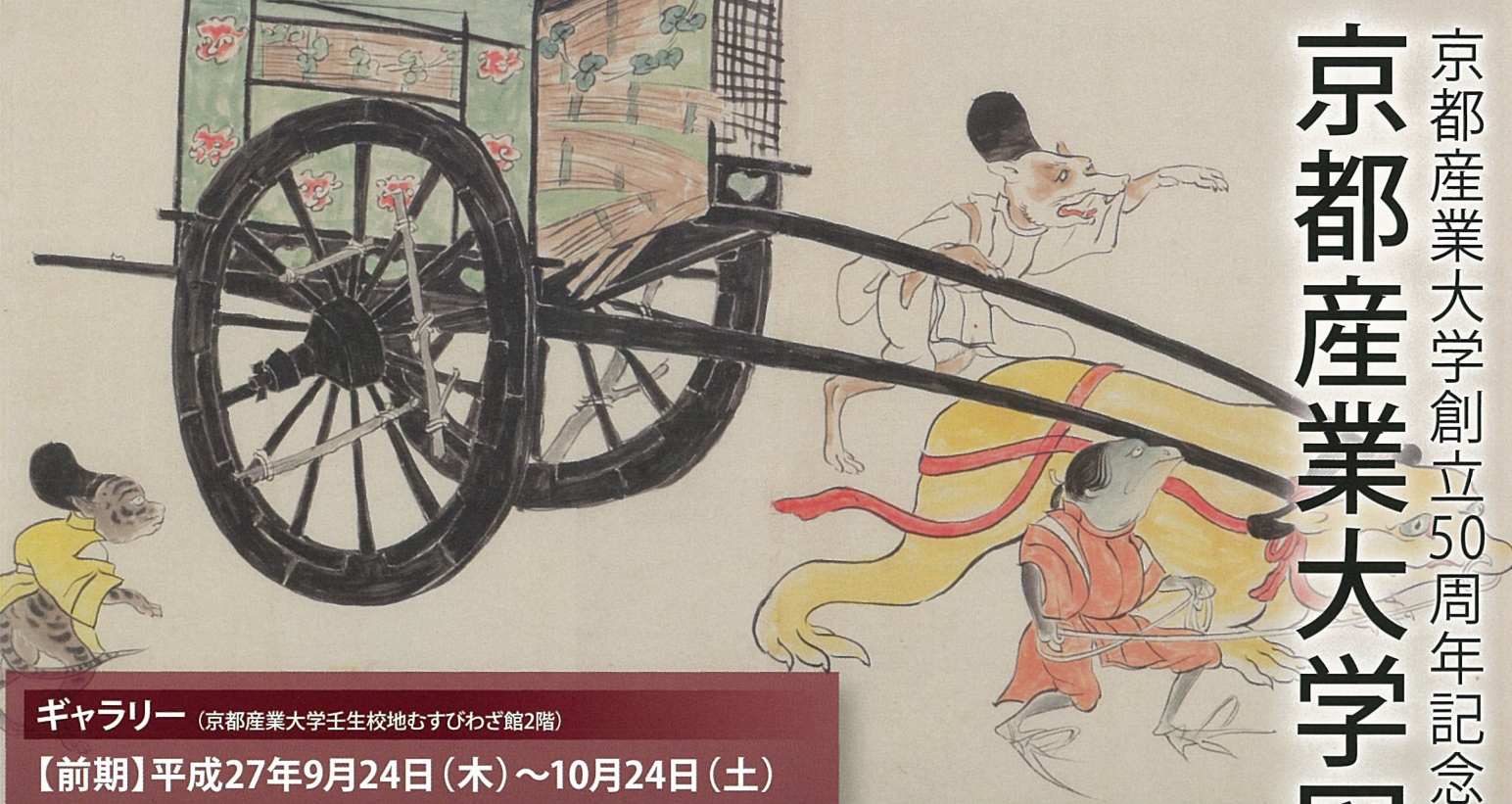
▲『異形賀茂祭絵巻』(後期)