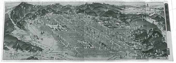
吉田初三郎作『京都圖繪』(前期)