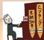
C.フランク生誕200年記念ロゴ

・公演当日はマスクを着用ください。 ・公演当日に検温を実施し、37.5度以上の発熱および咳など体調不良が認められる方は、入場をお断りします。 ・状況により、中止の可能性がございますのでご了承ください。最新情報は本学HPにてお知らせします。