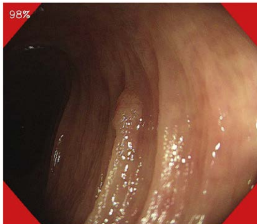
図 2. 実装済みソフトウェアのアウトプット