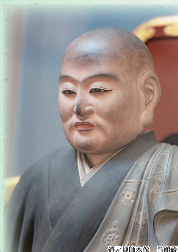
道元禅師木像 当館蔵