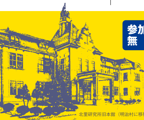
北里研究所旧本館 (明治村に移築保存)