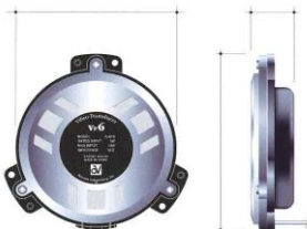
トランスデューサーVp6

(株)アークヴ・ラボのVISIC（体感音響）は、医療、ウエルネス福祉分野、文化施設分野、エンターテイメント分野、酒・食品・水分野、建築分野、音響分野の各産業界で活用されている。