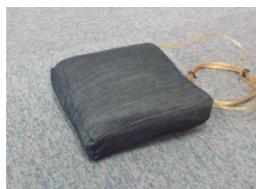
トランスデューサー内蔵クッション