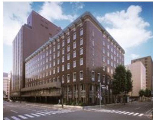
札幌グランドホテル

学校法人酪農学園では、酪農や牛乳、乳製品に対する理解を深めてもらうとともに、牛乳類とスイーツの結びつきによる牛乳の消費拡大を図るため、全国の高校生から牛乳類を使ったお菓子レシピコンテストを2006年度から実施しており、今年で12回目となります。札幌グランドホテルは酪農学園大学との連携協定の一環として、審査員として協力を行い、その中で、今回は入賞作品より4作品をホテル内ショップ「ザ・ベーカリー&ペイストリー」にて販売いたします。