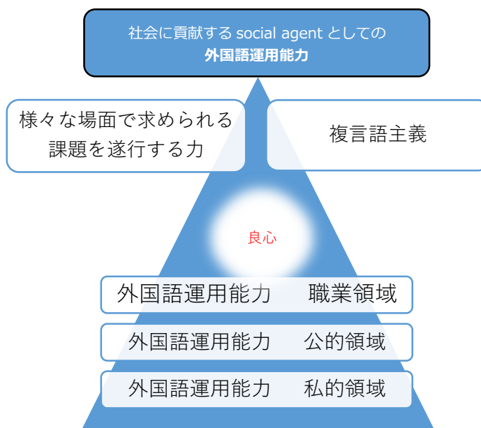
図2 CEFR および同志社大学の理念に基づく外国語運用能力及び教育に関する理念図

CEFR では、social agent の育成を大きな目標に据えている。図2は、同志社大学の教育理念を踏まえた人材育成を目指し、外国語運用能力と教育のありようを提示したものである。