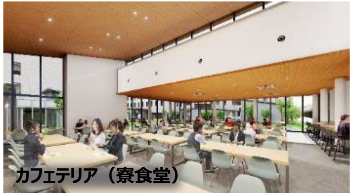
カフェテリア（寮食堂）