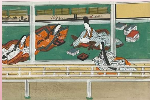
奈良絵本 源氏物語 梅枝