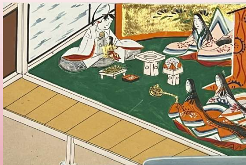
奈良絵本 狭衣大将物語