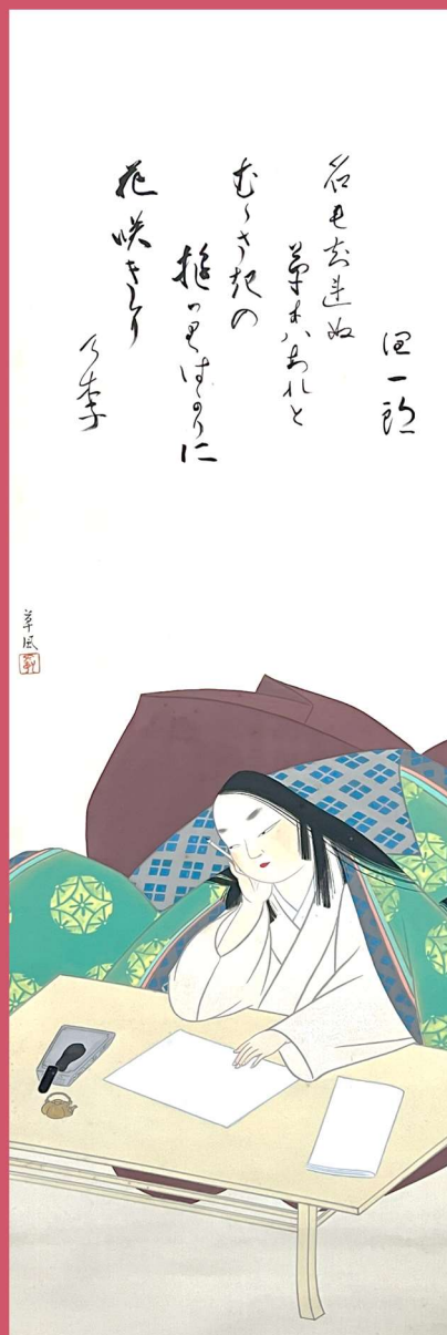
長野草風「紫式部像 谷崎潤一郎 讃」