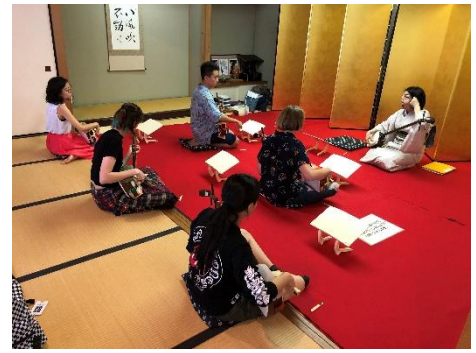
▲過去の開催の様子（三味線）