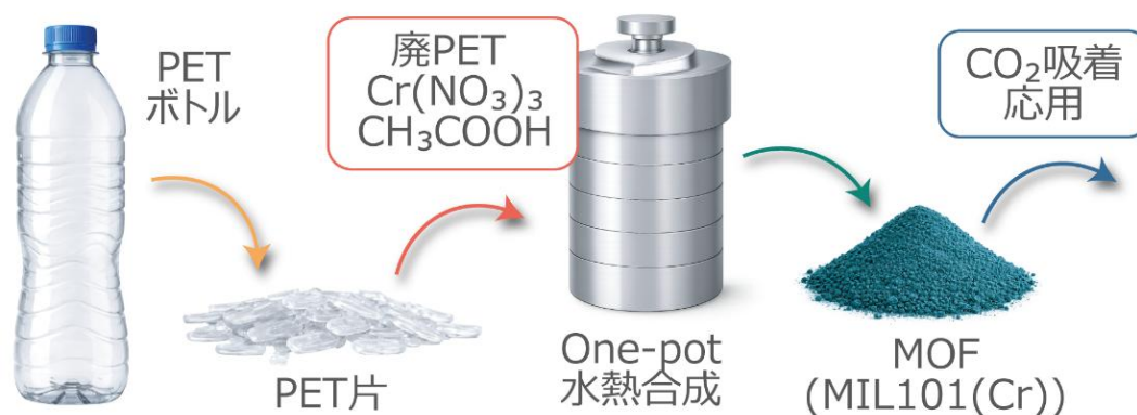
【図 1】 廃 PET から MOF を合成し CO 2 吸着へ応用するコンセプト図

このような背景のもと、本研究では、廃 PET を単に再利用するのではなく、高機能材料へと転換する「アップサイクル」に着目しました。PET の主成分には、その高分子骨格の大部分(約 85%)を占めるテレフタル酸 注 8) 由来ユニットが含まれており、「有機金属構造体(MOF)」の原料として利用可能なテレフタル酸構造を豊富に有していることから、廃 PET を原料として MOF を直接合成し、CO 2 吸着材料として活用することを目的としました(図 1)。