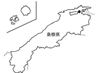
図1 西川津遺跡の位置

そこで、筆者らは弥生時代の山陰地方でもブタ飼育が行われていたかどうかを確認するために、西川津遺跡(島根県松江市)(図1)において出土したイノシシ類(ブタと野生イノシシをまとめてこう呼ぶ)の下顎骨について「形態」と「個体群の年齢構成」を検討しました。