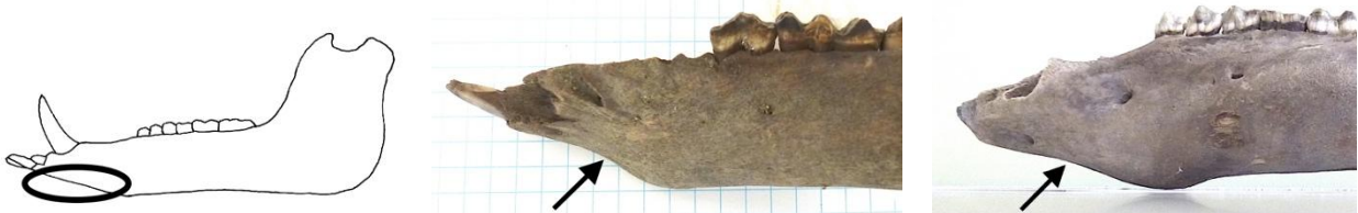
図2 下顎骨の前面 図3-1 前面が明らかにへこむ出土下顎骨 図3-2 前面が弱くへこむ出土下顎骨

次に、飼育されていたか否かを判定する指標として個体群の年齢構成に着目し、後臼歯の萌出状態 注3) からブタの年齢を査定しました。飼育下では肉の生産効率を考えて若獣が選択的に屠殺(とさつ)されるので、若獣が多くなるからです。下顎骨93点のうち、後臼歯部分の残っている45個体で年齢を判定することができました。これらを幼獣(生まれてから第一後臼歯が萌出した0.5歳まで)・若獣(0.5歳からすべての歯が生え揃う3歳頃まで)・成獣(すべての歯が生え揃って以降)に分類したところ、幼獣:若獣:成獣=12個体(27%):19個体(42%):14個体(31%)となりました。さらにこの結果を、野生イノシシを狩猟していた縄文時代遺跡(愛知県の伊川津貝塚)およびブタが飼育されていた弥生時代遺跡(愛知県の朝日遺跡)や中近世の遺跡(沖縄県の東村跡)と比較しました(表1・図4)。